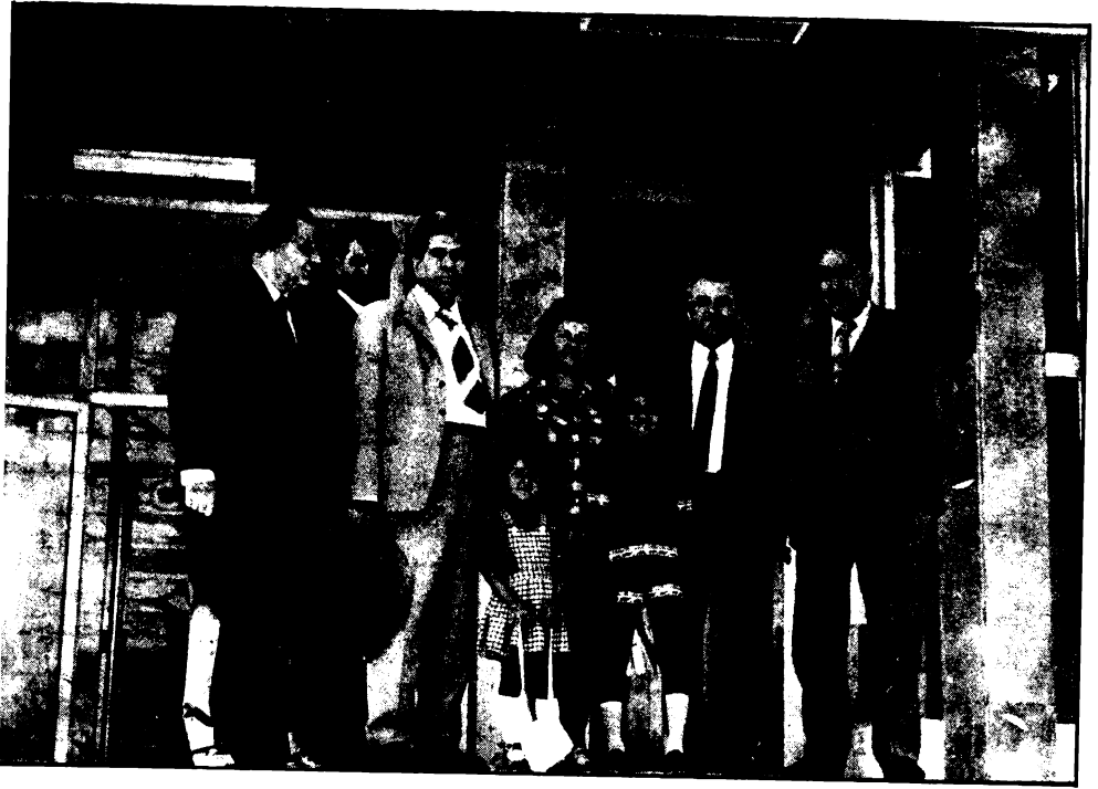
مع الرفيق خالد بكداش في بلغاريا تموز ١٩٧٣